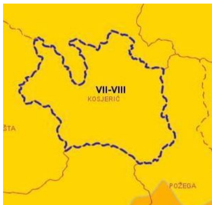
Слика бр. 1: Карта сеизмичког хазарда за повратни период 475 година изражен у степенима макросеизмичког интензитета